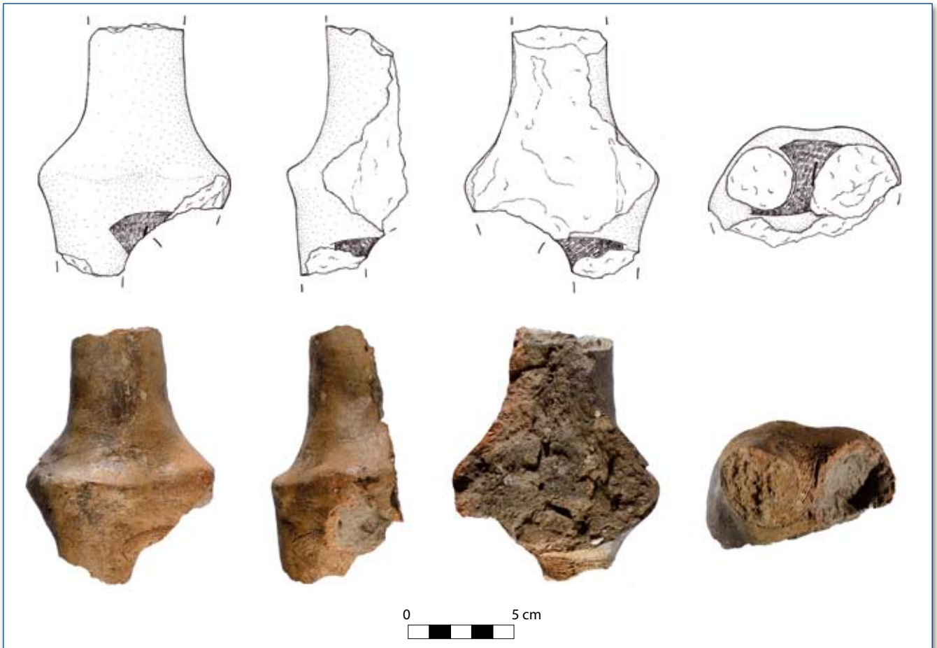
Figura 2 - Statuina Favella 2 (disegni di S. Cicellino).