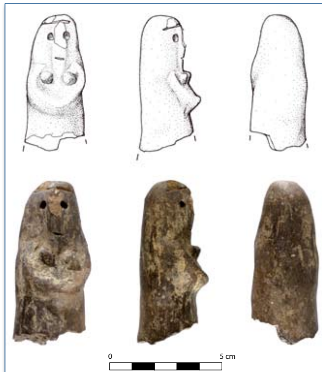
Figura 3 - Statuina Favella 3 (disegni di S. Cicellino).

ratteri identificativi della femminilità, secondo un procedimento piuttosto diffuso nelle statuine muliebri di età preistorica.