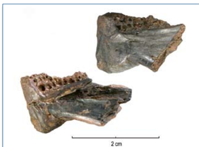
Figura 1 - Dentali destri di cernia (strato 4, fossa Y, struttura D), norma mediale.

Alcune ossa di cefalo e di cernia, sia del cranio che del corpo (totale NR 28), tutte provenienti dallo strato US 4, fossa Y della struttura D, sono state esposte al fuoco o comunque al contatto con braci fino ad assumere la caratteristica colorazione nera o grigio-biancastra (fig. 1). Questa colorazione, come è stato notato sperimentalmente, potrebbe dipendere non solo dalla temperatura raggiunta (comunque più di 550°C), ma anche dalla struttura stessa dell'osso e dal tipo di esposizione al calore (PEN-NEMANN, COLLEY 1989). Il fuoco causa fratture alle apofisi neurali ed emale delle vertebre ed in modo particolare agli elementi laminari, presenti soprattutto nel cranio (opercolari e neurocranio), rendendoli indeterminabili anche a livello anatomico.