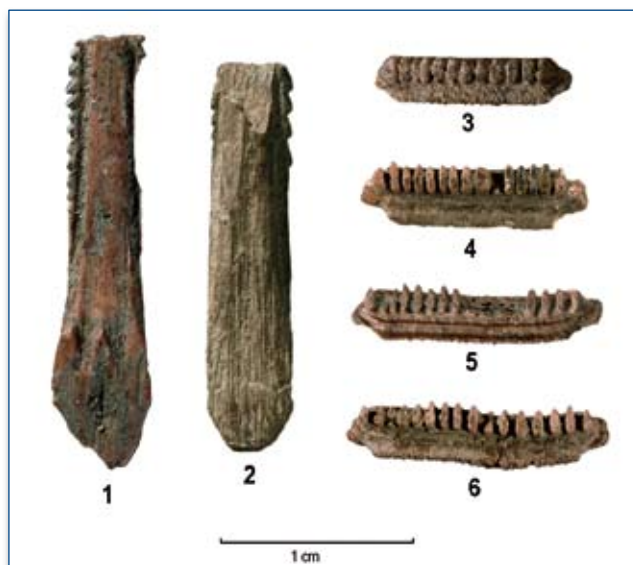
Figura 2 - Aculei caudali (nn° 1 e 2) e placche dentali (nn° 3-6), riferibili a razze velenose (Dasiatoidi), provenienti dallo strato 4, struttura D fossa Y.

Anche se si tratta di pesci poco frequenti nell'alimentazione attuale, non sono rari in siti archeologici di questo periodo, anche in ambiti culturali completamente diversi. In contesti non italiani ma coevi, due serie dentali (di Myliobatis aquila , Linnaeus 1758) sono state infatti identificate tra i materiali dei chiocciolai mesolitici sulla costa del Portogallo (con datazioni radiocarboniche tra la fine dell'VIII e tutto il VII millennio B.P.; LE GALL